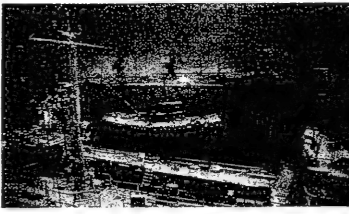
ميناء مومانسك في القطب الشمالي.

منطقة القطب الشمالي السوفيتية التي تضم الجرف القاري من المحيط المتجمد الشمالي، تراسم من الغرب الى الشرق عبر البلاد كله. ويرى العلماء ان هذه المنطقة غنية بالنفط والغاز كما تتركز فيها ايضا ثروات طبيعية اخرى غنية كل الغنى بينها الفحم وخامات المعادن المتعددة الفلزات وموطن القصدير والذهب.